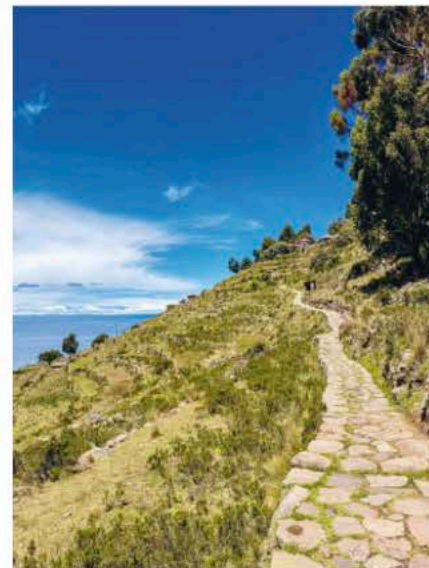
Taquile: Der Aufstieg über die terrassenförmigen Hügel der Insel – dahinter die endlose Weite des Titicacasees.

Auch Restaurants gibt es keine: Stattdessen schleppt sich unsere Gruppe mit schepperndem Atem den Berg zur Wohnung von Antonio hinauf. Mit schüchternem Lächeln empfängt uns der 30-jährige – und laut rot-weisser Mütze ledig – Taquileño auf einem grossen Sonnendeck mit Blick über die weiten terrassenförmigen Hügel. Neben Kartoffeln, Bohnen und Mais wird auf ihnen auch Quinoa angebaut, für die deftige Suppe unseres ersten Gangs. Das Highlight ist aber die «Trout a la Taquileña», frische gegrillte Forelle mit Andenkräutern und frittierten Kartoffelstreifen.