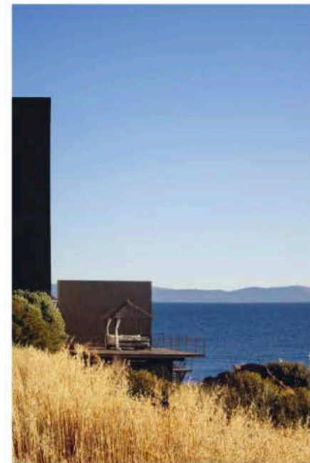
Das «Titilaka» thront auf einer privaten Halbinsel aus rotem Sandstein – achtzehn Zimmer, ringsum tiefblaues Wasser, 3810 Meter über dem Meer.

Genau das ist mein Plan. Während die meisten Besucher als Hauptziel Machu Picchu auf dem Programm haben, will ich diesmal andere Superlative anpeilen – denn von denen gibt es in Peru einige. Erste Station: das höchstgelegene schiffbare Gewässer der Welt. Mit 8372 Quadratkilometern umfasst der Titicacasee mehr als ein Fünftel der Oberfläche der Schweiz und hat die Aura eines verwunschenen Märchenlandes. Das intensive Blau des Wassers raubt mir den Atem – was zugegebenermaßen auch an der Höhe liegt. Auf 3810 Metern ist die Luft dünn, die Höhenkrankheit sofort spürbar. «Gegen «Soroche» hilft viel trinken, vor allem Koka-Tee», hat mir Elider schon am Flughafen von Juliaca ans Herz gelegt. Und nein, es habe keine Rauschwirkung. Denn auch wenn aus den Blättern Kokain hergestellt wird: Sie enthalten nur etwa ein Prozent Alkaoid, das durch Extrahieren gewonnen und erst durch starke Anreicherung und Weiterverarbeitung zum illegalen weissen Pulver wird, lerne ich. Stattdessen wird die Pflanze in den hohen Andenregionen lieber abgebrüht. Die Wirkung eines Koka-Tees hat ungefähr die Aufputzwirkung eines starken Kaffees oder Schwarztees.