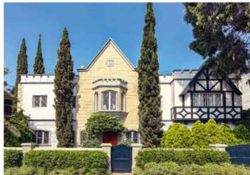
Wie bei Freunden zu Gast: Das «Atemporal by Andean» in Miraflores – sechs Zimmer in einem Tudor-Haus aus den 1940ern, ganz ohne Lobby, dafür mit «Honor Bar».