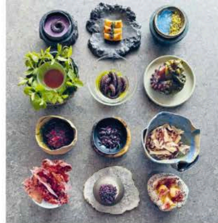
Virgilio Martínez hat mit seinem «Centrals» die peruanische Küche neu definiert – 2024 das beste Restaurant der Welt.